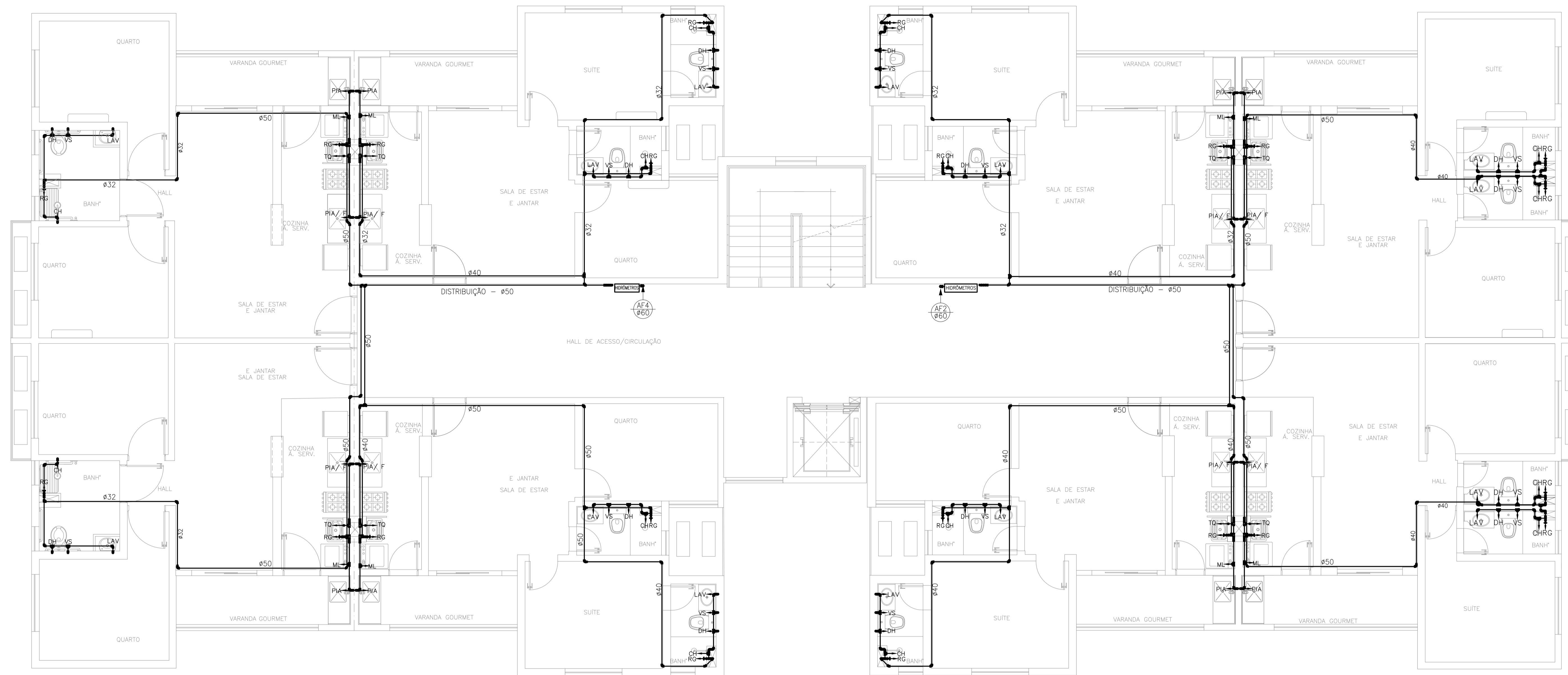
PLANTA BAIXA - 3º PAV. - BLOCO PCD ESC. 1/50